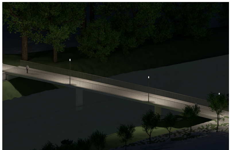
Nuovo ponte Platzspitz come accesso allo sbarramento