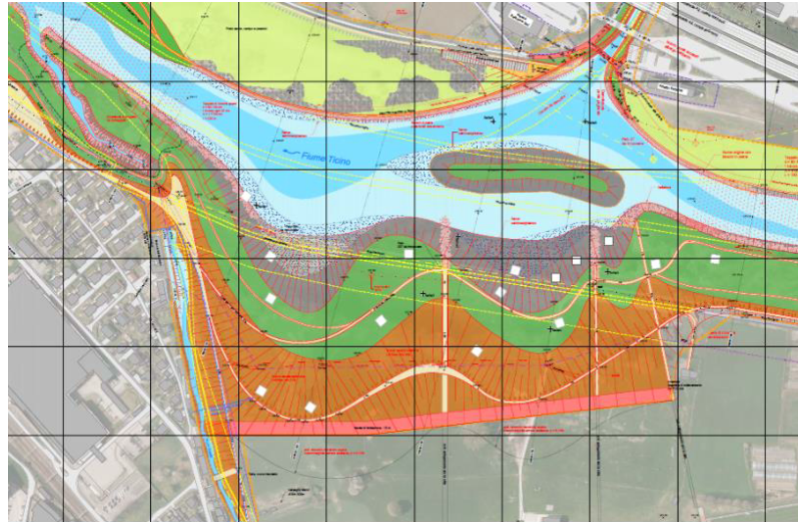
Erweiterung Saleggi, Mündung Sementina, Bach Guasta