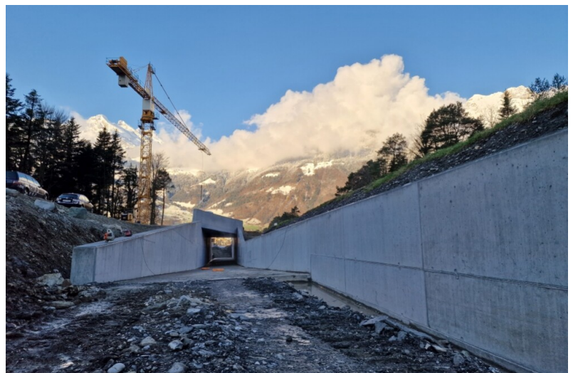
Nouveau passage de crue de Schächenmatt