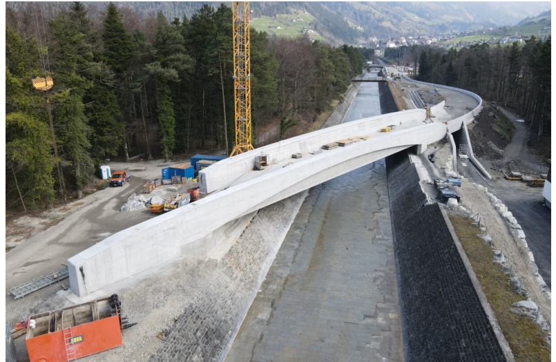
Pont Schächen coffré