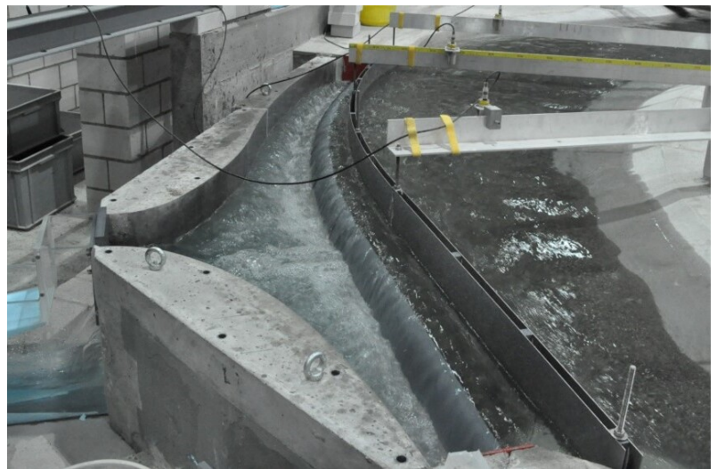
Hydraulischer Modellversuch des Einlaufbauwerks an der VAW