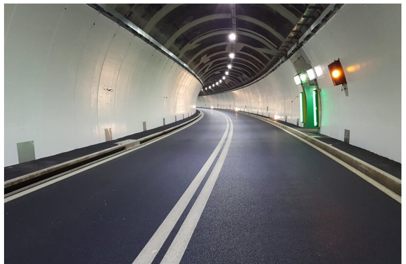
Fahrraum mit Querverbindung zum SiSto