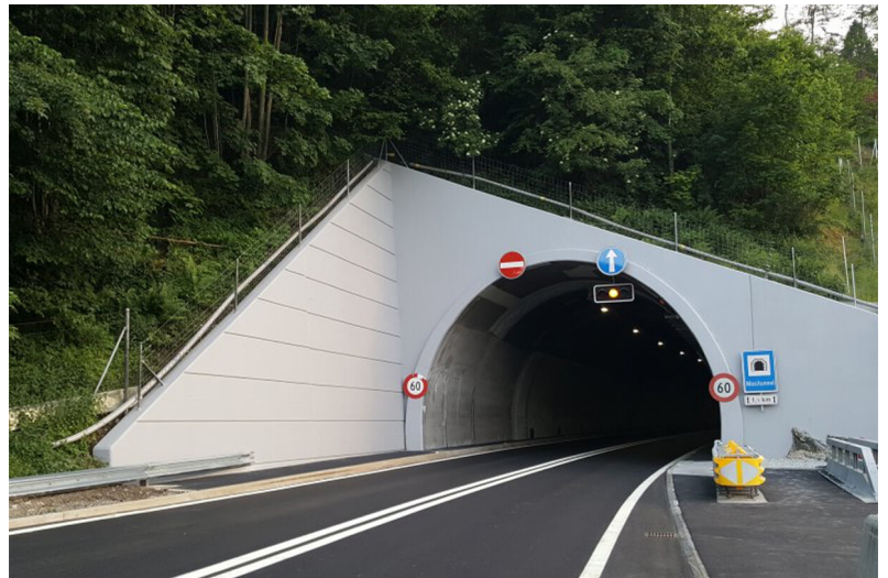
Nordportal, Sanierte Tunnelröhre, 12.05.2019