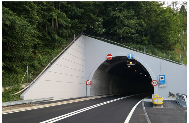
Nordportal, Sanierte Tunnelröhre, 12.05.2019