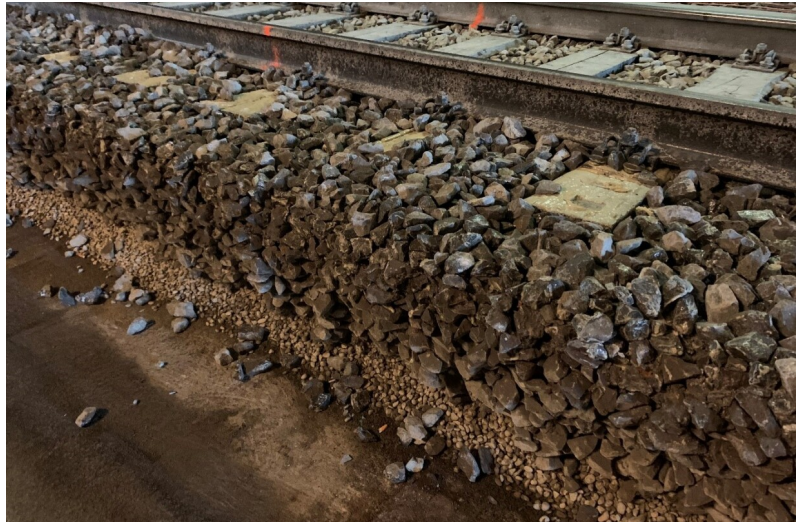
Paroi verticale après collage avec exploitation ferroviaire sur la voie existante

Im Maggia Engineering SA a analysé le comportement géomécanique de la superstructure du ballast et a développé sur cette base une méthode de dimensionnement qui permet d'évaluer les modifications de la superstructure en termes de stabilité et de comportement porteur et de planifier les mesures correspondantes.