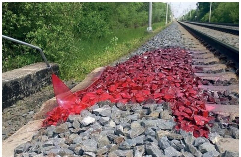
La stabilisation de la surface du ballast ferroviaire peut être rendue visible par coloration