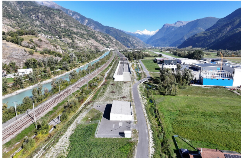
Gedeckter Einschnitt Raron mit Blick auf Zentrale und Offene Strecke Ost

Das Projekt wurde als BIM-Pilotprojekt umgesetzt. Dabei wurden die beiden technischen Zentralen sowie die Pumpstation modelliert und gewerkeübergreifend koordiniert.