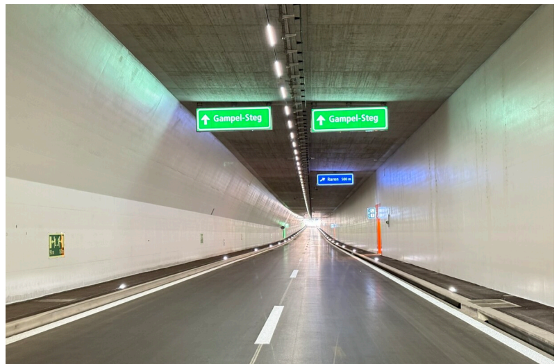
Röhre Nord des Gedeckten Einschnitts Raron mit Blick in Richtung Lausanne