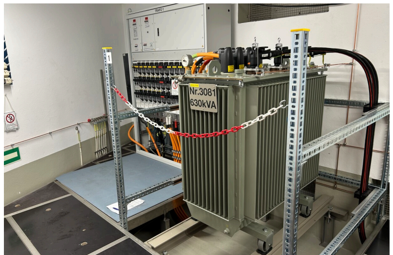
Fertig ausgerüstete umgebaute Trafostation